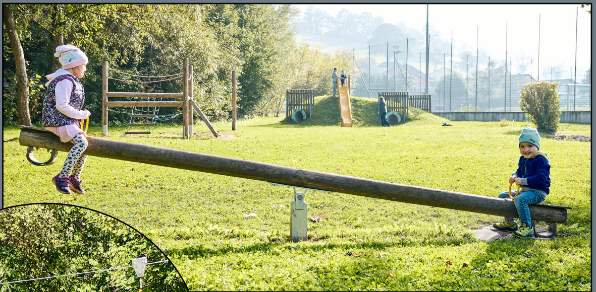
Bild 2: Wippe, Klettergerüst, Rutsche und Tunnel Bild 3: Calisthenics