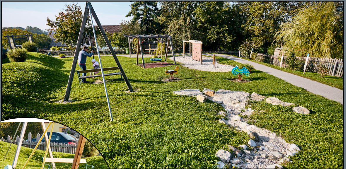
Bild 4: Kletterwand, künstlicher Bachlauf, Flying-Fox, Wipptiere Bild 5: Korbschaukel