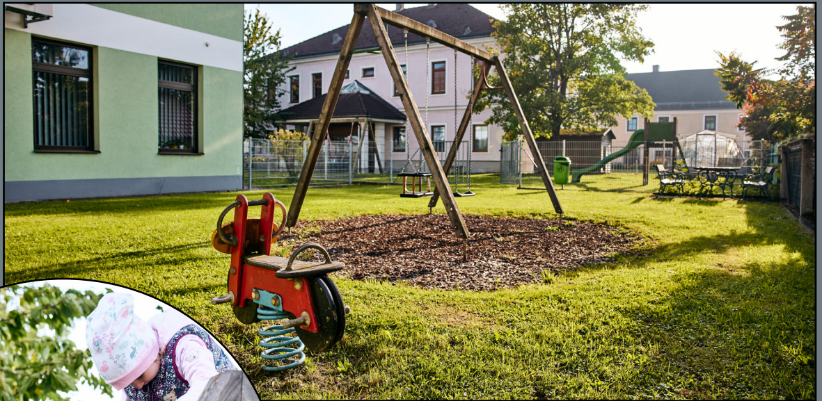
Bild 6: Schaukel, Rutsche Bild 7: Klettergerüst