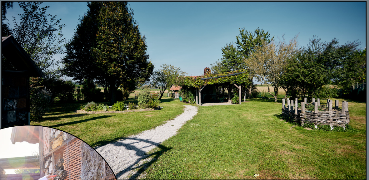
Bild 8: Pergola, Kräuter Beet, Hochbeet, Weiden Tipi Bild 9: Insektenhotel