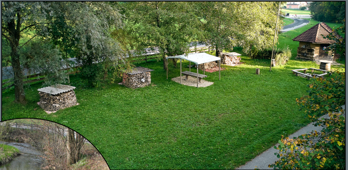
Bild 12: Feuerstelle Bild 13: Elzbach